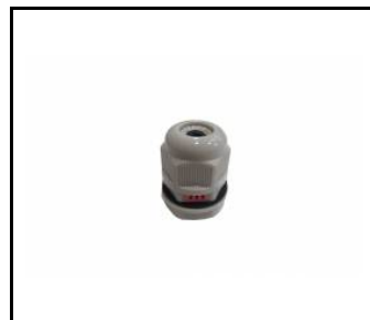
Variabilní odvodušňovací vývodka šedá M20*1,5 IP68 (16000507)