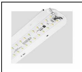
TYTAN MULTI LED 1450mm 3150- 5450lm 840 - světelný modul (358951)