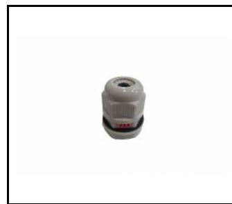
Variabilní odvodušňovací vývodka šedá M20*1,5 IP68 (16000507)