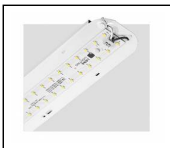
TYTAN MULTI LED 1150mm 5000- 8700lm 840 - světelný modul (358944)