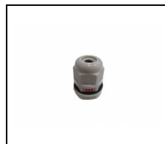
Variabilní odvodušňovací vývodka šedá M20*1,5 IP68 (16000507)