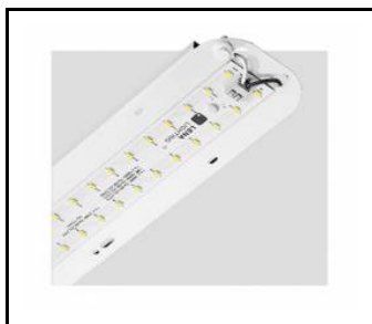
TYTAN MULTI LED 1150mm 5000- 8700lm 840 - světelný modul (358944)