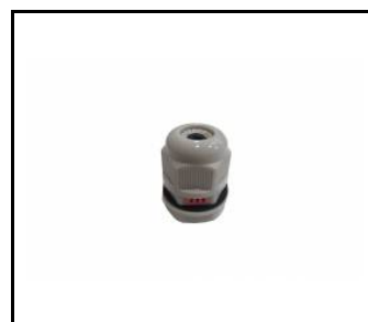
Variabilní odvodušňovací vývodka šedá M20*1,5 IP68 (16000507)