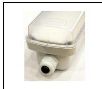
Zaslepovací zátka M16 různá PA černá - BPM-21 (60000006)