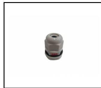
Variabilní odvodušňovací vývodka šedá M20*1,5 IP68 (16000507)