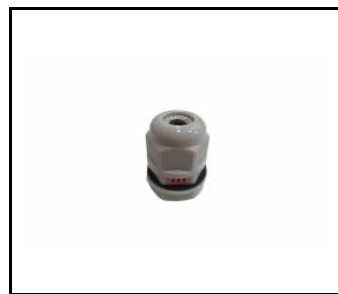
Variabilní odvodušňovací vývodka šedá M20*1,5 IP68 (16000507)