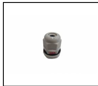
Variabilní odvzdušňovací vývodka šedá M20*1,5 IP68 (16000507)