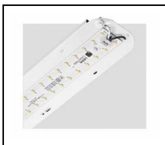
TYTAN MULTI LED 1450mm 3150- 5450lm 840 - světelný modul (358951)