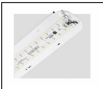
TYTAN MULTI LED 1150mm 2500- 4300lm 840 - světelný modul (358937)