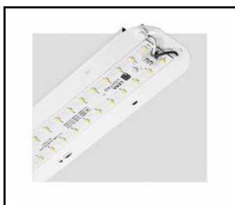
TYTAN MULTI LED 1450mm 3150- 5450lm 840 - světelný modul (358951)