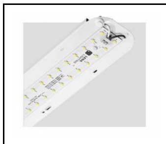
TYTAN MULTI LED 1150mm 2500- 4300lm 840 - světelný modul (358937)