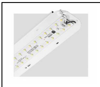
TYTAN MULTI LED 1450mm 3150- 5450lm 840 - světelný modul (358951)