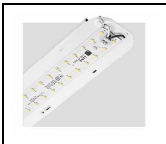
TYTAN MULTI LED 1150mm 5000- 8700lm 840 - světelný modul (358944)