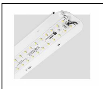
TYTAN MULTI LED 1150mm 5000- 8700lm 840 - světelný modul (358944)