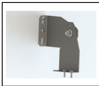
NASTAVITELNÁ RUKOJEŤ - TITANOVÁ LED. Sada LED pro průmysl (2 ks) (908200)