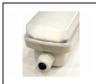
Zaslepovací zátka M16 různá PA černá - BPM-21 (60000006)