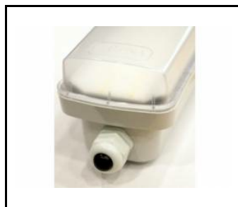
Zaslepovací zátka M16 různá PA černá - BPM-21 (60000006)