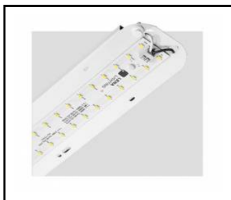
TYTAN MULTI LED 1450mm 3150- 5450lm 840 - světelný modul (358951)