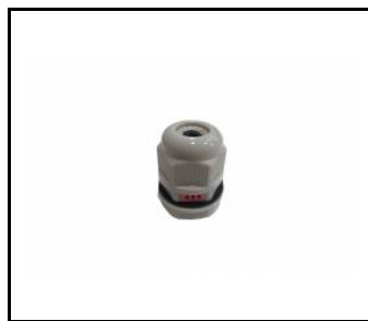
Variabilní odvodušňovací vývodka šedá M20*1,5 IP68 (16000507)