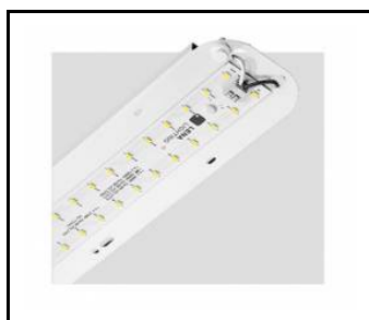
TYTAN MULTI LED 1150mm 2500- 4300lm 840 - světelný modul (358937)