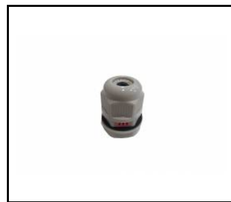
Variabilní odvodušňovací vývodka šedá M20*1,5 IP68 (16000507)