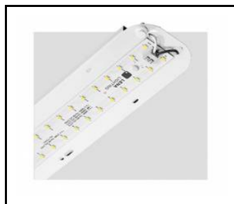
TYTAN MULTI LED 1450mm 3150- 5450lm 840 - světelný modul (358951)