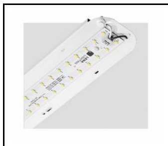
TYTAN MULTI LED 1150mm 5000- 8700lm 840 - světelný modul (358944)