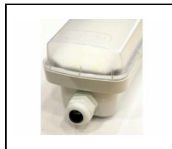
Zaslepovací zátka M16 různá PA černá - BPM-21 (60000006)