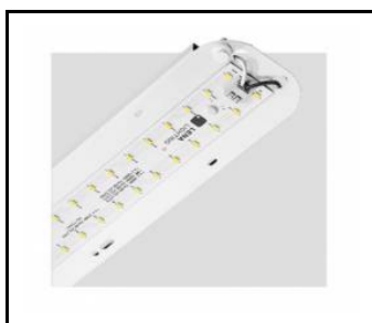
TYTAN MULTI LED 1450mm 3150- 5450lm 840 - světelný modul (358951)