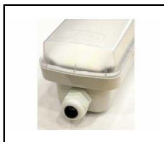
Zaslepovací zátka M16 různá PA černá - BPM-21 (60000006)