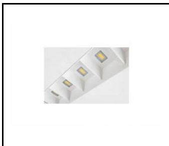
TERRA 2 LED

PODROBNÁ PRODUKTOVÁ KARTA TECHNICKÉ ÚDAJE