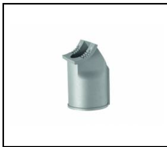
Montážní držák 78 mm (UL00229)