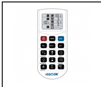
Programovací dálkový ovladač RC HAI HD05R pro HD0406VRH IoT (WSEL431)