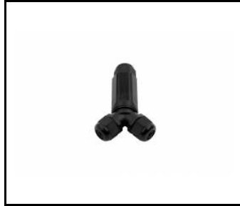
Konektor IP68 High-bay PA 6,6 černý DL06-3A-2Y (800ML208)