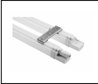
Dvojitý držák MIMO 2 LED (cpl) (100673)