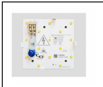
Gamma LED Basic 280 1500lm 840 (13W) - světelný modul (754968)