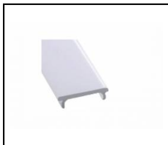
ELEGANTE SYSTEM LED klosz PC opal koextruze+měkký upevňovací díl 25m (388729)