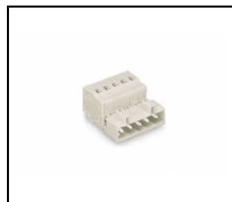
ELEGANTE SYSTEM LED zástrčka 5 pólů (388774)