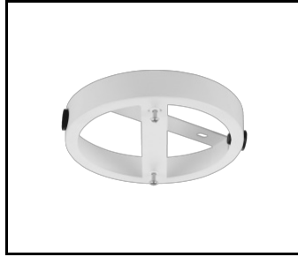
Stropní distanční rámeček DOT bílý matný (551161)