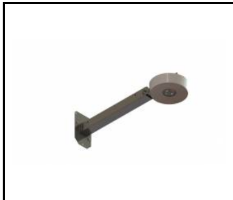
DOT CS rameno ocelové pozinkované (545672)