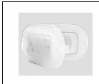
Oválný světelný modul LED Basic 840 (4.7 W) (233661)