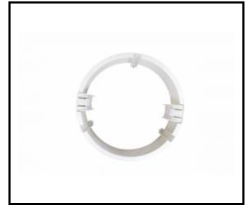
NECTRA LED IP44 20W/25W POUZDRO PRO POVRCHOVOU MONTÁŽ PC (059995)