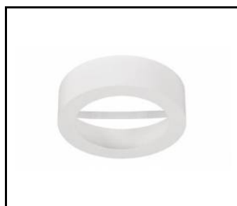
KULATÉ POUZDRO FRAGA 6W/11W. NECTRA 5W/7W IP44 (059841)