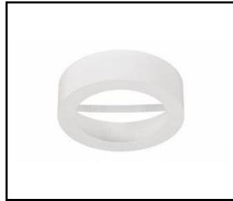
KULATÉ POUZDRO FRAGA 6W/11W. NECTRA 5W/7W IP44 (059841)