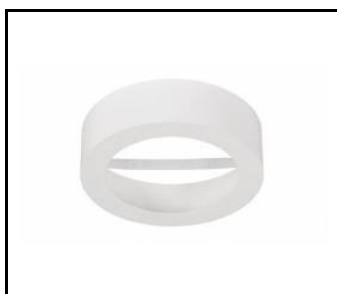
KULATÉ POUZDRO FRAGA 6W/11W. NECTRA 5W/7W IP44 (059841)