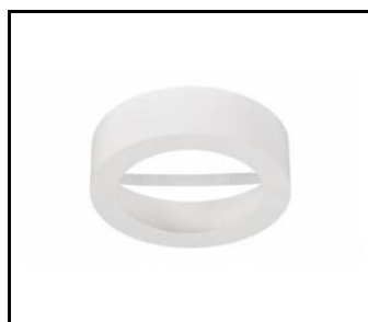
KULATÉ POUZDRO FRAGA 15W. NECTRA 9W/9W IP44 (059858)