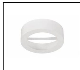
KULATÉ POUZDRO FRAGA 6W/11W. NECTRA 5W/7W IP44 (059841)