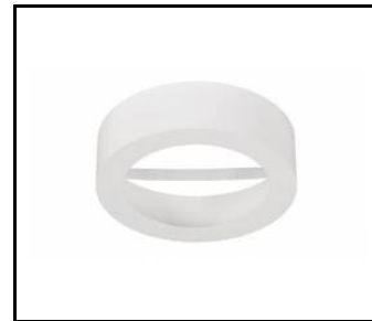
KULATÉ POUZDRO FRAGA 6W/11W. NECTRA 5W/7W IP44 (059841)