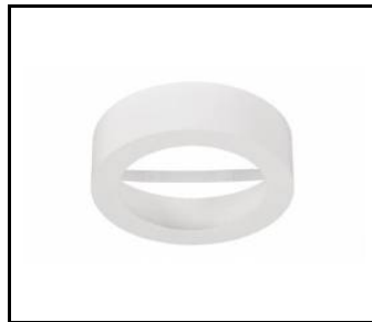
KULATÉ POUZDRO FRAGA 15W. NECTRA 9W/9W IP44 (059858)