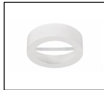
KULATÉ POUZDRO FRAGA 6W/11W. NECTRA 5W/7W IP44 (059841)