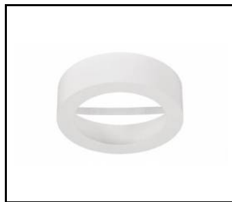
KULATÉ POUZDRO FRAGA 15W. NECTRA 9W/9W IP44 (059858)