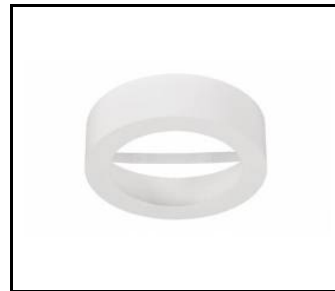
KULATÉ POUZDRO FRAGA 6W/11W. NECTRA 5W/7W IP44 (059841)