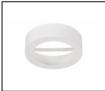
NECTRA 18W - KRUHOVÝ KRYT PRO POVRCHOVOU MONTÁŽ - BÍLÝ (059759)