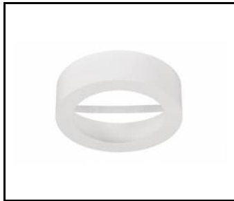
KULATÉ POUZDRO FRAGA 6W/11W. NECTRA 5W/7W IP44 (059841)