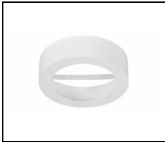
KULATÉ POUZDRO FRAGA 15W. NECTRA 9W/9W IP44 (059858)