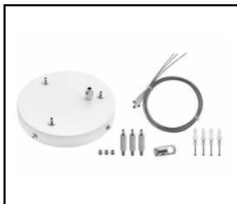
Zavěšení Coria set 3 fi 150 white dali (556746)