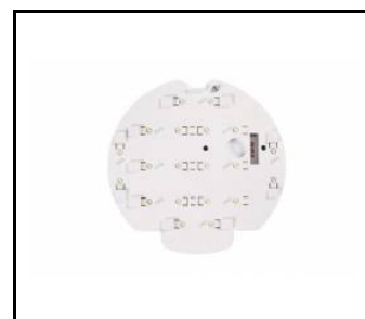
CORAL- 10W servisní sada 10W RCR 4000K (229787)