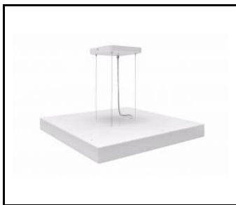
COMPACT LED EVO Z - SYSTEM ZWIESZANIA