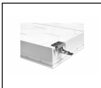
COMPACT LED EVO Zacpek do sufitów KG (4 szt.) / Držáky pro montáž na sádrokarton (4 ks) (630033)