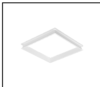
Rám ocelové konstrukce bílé barvy RAL9016 600x600 SM "well effect" (998966)