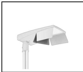
Coupe-flux arrière T Tiara 2 LED M RAL9006 (MOQ 80szt.) (UL00958)