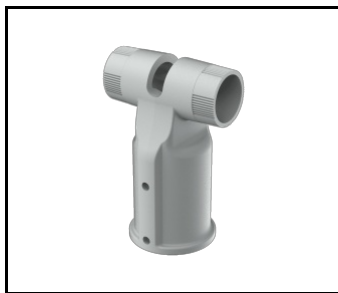
TIARA 2 LED Support réglable Dark Sky diamètre 64 mm gris (804625)