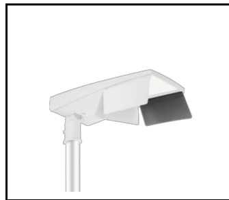
Rückwand L (links) Tiara 2 LED M (UL00960)