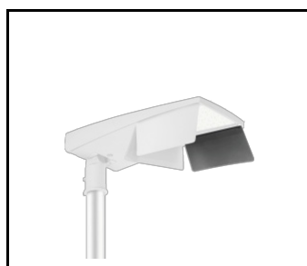
Rückwand L (links) Tiara 2 LED M (UL00960)