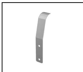
Abdeckung für Halterung Tiara 2 LED 64 mm (989766)

Erstellungsdatum der Karte: 05 Dezember 2025