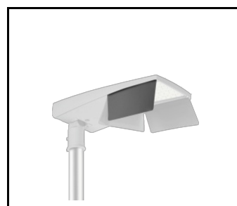
Rückschild P (rechts) Tiara 2 LED M (UL00959)