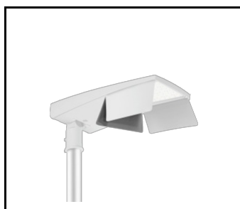
Rückwand T (zurück) Tiara 2 LED M RAL9006 (Mindestbestellmenge 80 Stück) (UL00958)