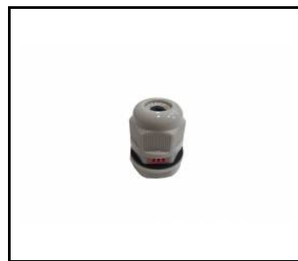
Dławnica odpowietrzająca różne szara M20*1.5 IP68 (16000507)