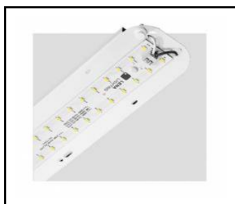
TYTAN MULTI LED 1150mm 2500-4300lm 840 - moduł świetlny (358937)