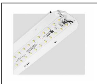
TYTAN MULTI LED 1150mm 5000-8700lm 840 - moduł świetlny (358944)