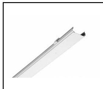
LINEA S LED grille métallique 588mm (980985)