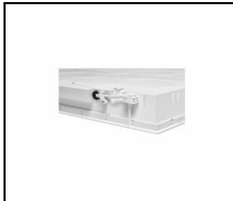
COMPACT LED EVO P ZK SZYBKOWIĄCZE