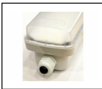
Bouchon presse-étoupe M16. divers PA noir M-16 - BPM-21 (60000006)

Date de création de la carte: 04 mai 2026