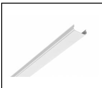
LINEA S LED zakończenie IP40 (980060)