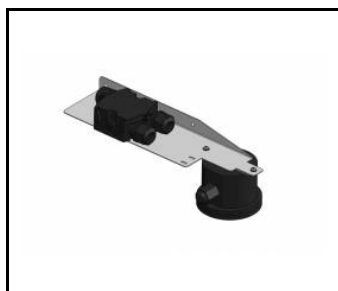
ARENA LED - RCR-Sensor - eingestellt (483240)

Erstellungsdatum der Karte: 19 Juli 2022