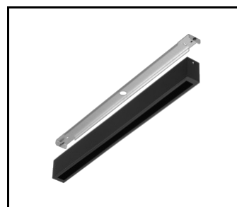
Cadre de surface Terrano noir mat RAL9005 573x38x60 (420948)

Date de création de la carte: 28 février 2025