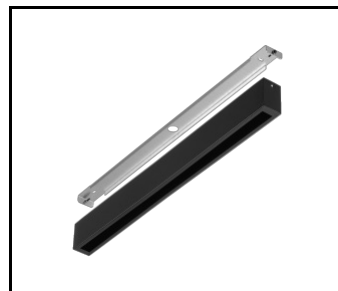
Cadre de surface Terrano noir mat RAL9005 573x38x60 (420948)