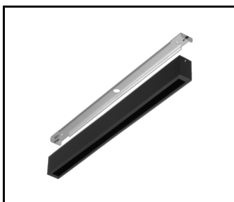
Terrano cadre apparent noir mat RAL9005 573x38x60 - ouverture latérale + presse-étoupe (583698)

Date de création de la carte: 13 février 2026