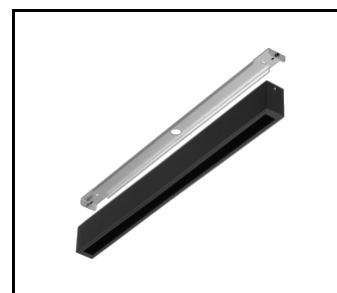
Cadre de surface Terrano noir mat RAL9005 573x38x60 (420948)

Date de création de la carte: 28 février 2025