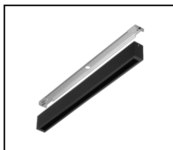
Cadre de surface Terrano noir mat RAL9005 573x38x60 (420948)

Date de création de la carte: 28 février 2025