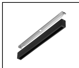
Cadre de surface Terrano noir mat RAL9005 573x38x60 (420948)

Date de création de la carte: 28 février 2025