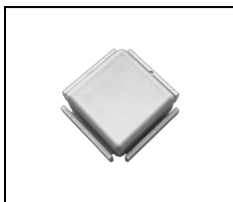
Terrano weißer Stecker (937408)