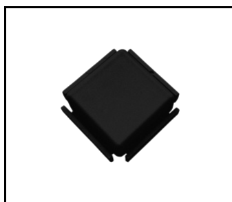
Terrano schwarzer Stecker (937415)

Erstellungsdatum der Karte: 10 Juli 2024